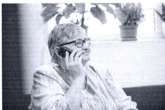
PLASARE DE COMENZI ONLINE CU LIVRARE LA DOMICILIU